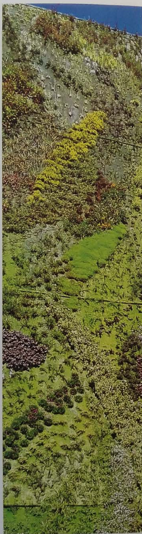
El jardín vertical del Caixaforum es un tapiz vivo y lleno de alegría, logrado a base de texturas y colores

Uno de ellos se encuentra en el hotel Mercure Santo Domingo, en la calle San Bernardo, entre la Gran Vía y el Palacio Real, y a pocos pasos de la Plaza Mayor. Adorna el patio interior de este estiloso hotel y tiene un diseño bastante particular; ya no está ordenado en manchas cromáticas, sino que tiende más a la naturalidad y, al mismo