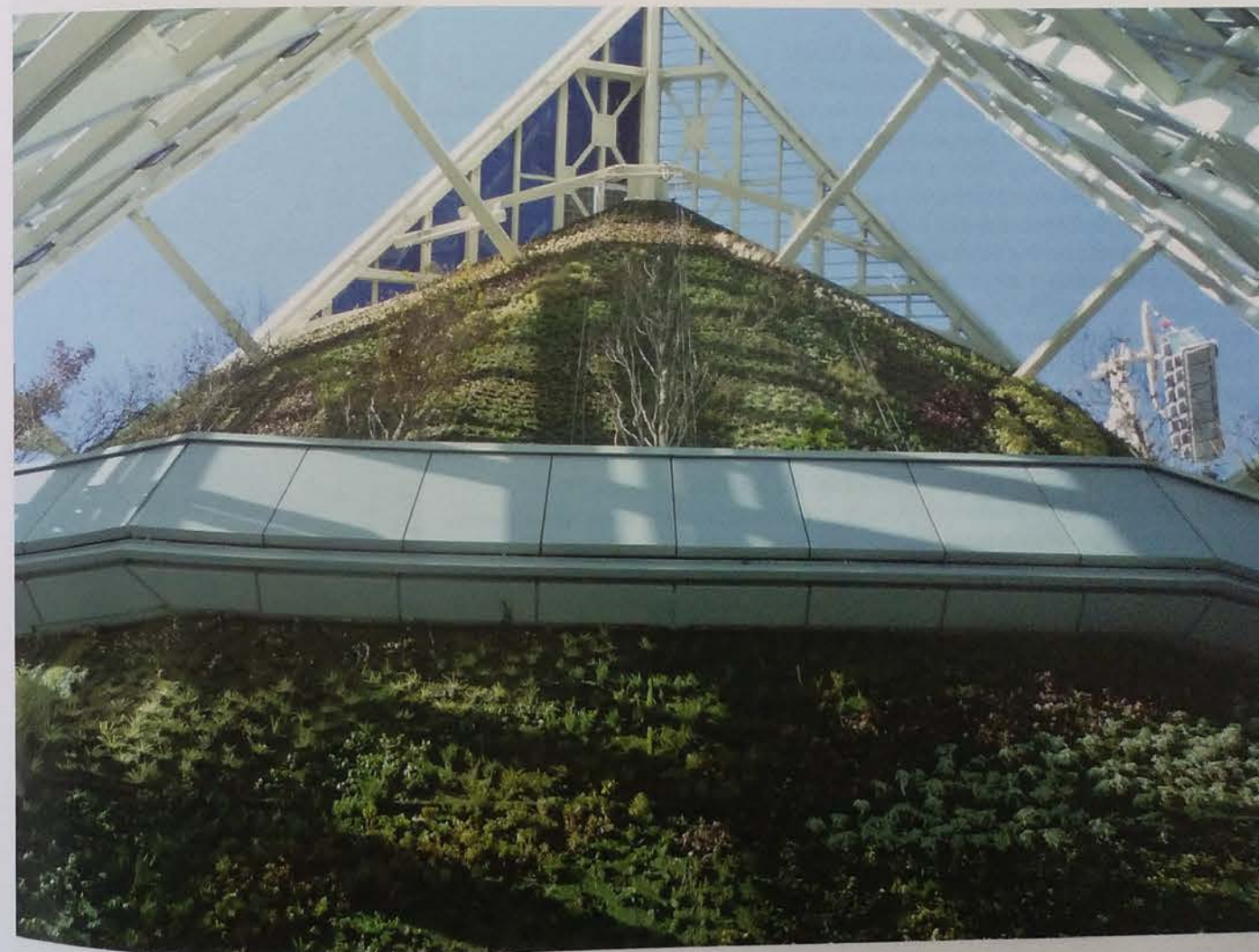
Esta obra de Blanc corona el edificio más alto de España en Madrid

Hacer posible lo imposible, convertir algo tan inerte como la fachada de una casa en un elemento vibrante y lleno de vida es hoy una realidad gracias a las nuevas técnicas de la jardinería. En las grandes ciudades crecen árboles en muros de hormigón y los paisajistas y arquitectos juegan hoy en sus proyectos con un elemento tan verde como espectacular: los jardines verticales. Te llevamos a visitar los más destacados de Madrid. Por Mercedes Valenzuela